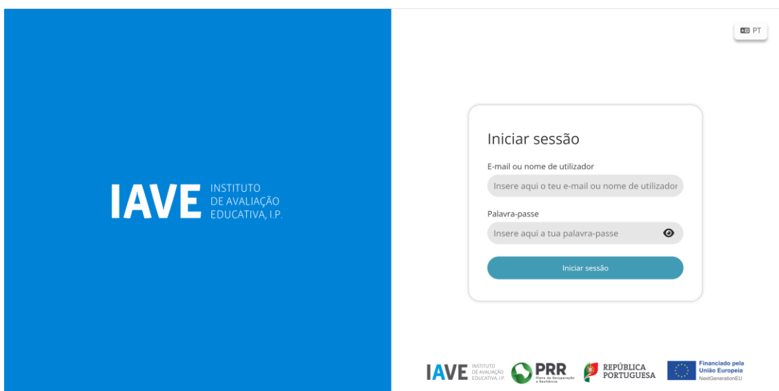
Figura 1 – Acesso à Plataforma de Realização das Provas Eletrónicas do IAVE

(Obs.: Para as escolas que optaram pelo offline em rede ou standalone, os procedimentos para acederem à Plataforma de Realização das Provas Eletrónicas do IAVE irão ser oportunamente divulgados)