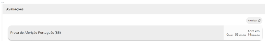
Figura 2 – Acesso à prova a realizar

5.8. Nas provas ao clicar em “Iniciar sessão”, por exemplo, para um aluno que realiza a prova de aferição de Português (85), aparece o seguinte ecrã: