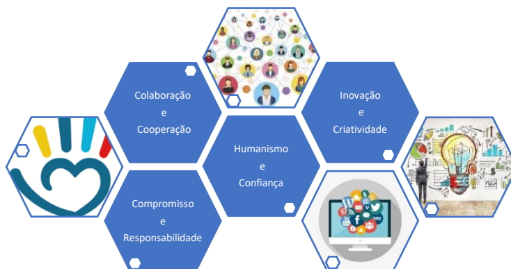
Fig. 2 – Pilares de uma Liderança

A minha liderança (alicerçada na conjugação das perspetivas transformacional, democrática e instrucional) assentará nos pilares ilustrados na imagem infra e pretende contribuir para a “agregação, vinculação e criação de sinergias na organização que no seu conjunto têm um impacto positivo e significativo” (Pina, 2015) em função de um projeto e uma visão de escola partilhadas pelos intervenientes.