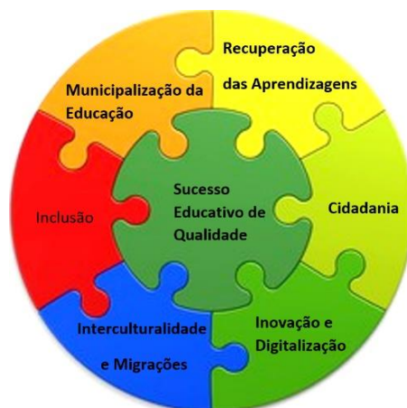
Fig. 1 – Desafios da Educação em Portugal

Perante a abertura de concurso, apresento a minha candidatura a Diretora do AEPPN para o quadriénio 2023-2027. Enquanto professora do quadro deste agrupamento sinto-me no dever/obrigação de apresentar um PI que contribua para abraçar os atuais e futuros desafios do Agrupamento.